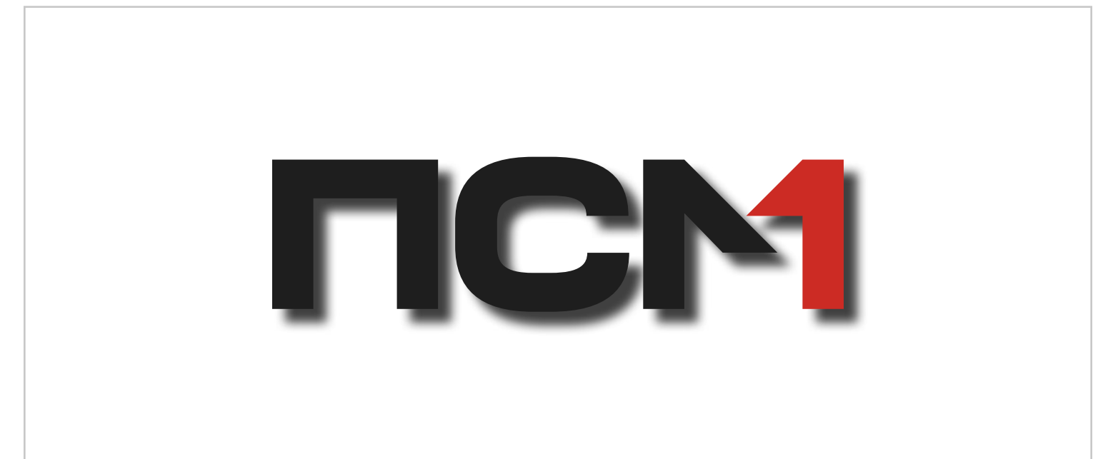
Недопустимо применение эффектов к логотипу.